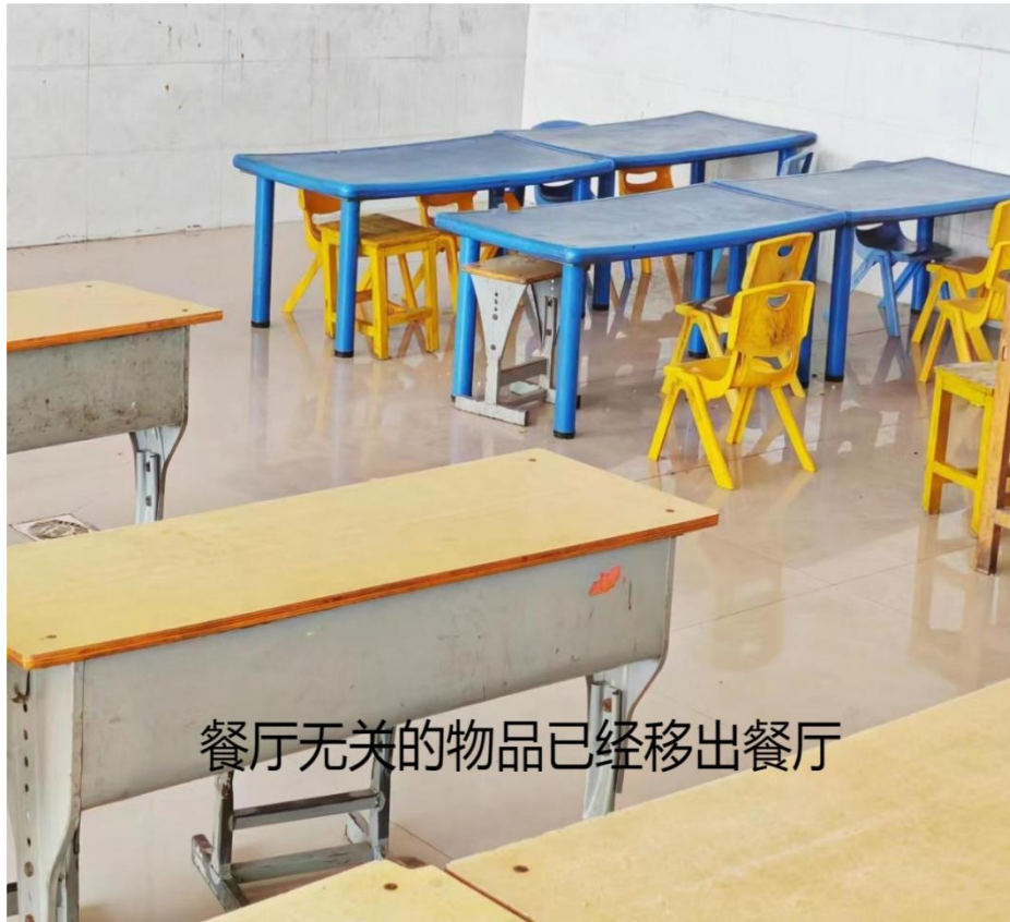
餐厅无关的物品已经移出餐厅